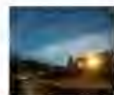
Chalet Hébergement & restauration Col de la Loge

Des plats 'maison' faits à partir de produits locaux, un bar chaleureux, une immense salle de restaurant, des salles de séminaires et 70 couchages, Frédérique & Isabelle SADOT vous accueillent au Chalet du Col de la Loge toute l'année, et ce soir... Réservation au 04.77.24.70.76